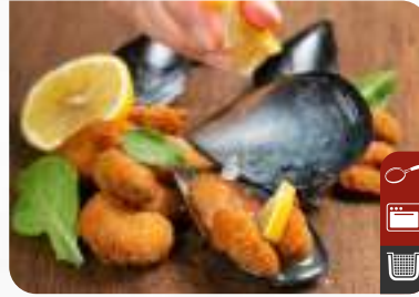
ÇITIR MİDYE TAVA Crispy Mussels

Ürün Kodu / Product Code : 1.01.06.0.010 Birim ağırlık / Unit weight : 9 g ± 10% Ambalaj / Packaging : 1 kg/2lb 3.2oz