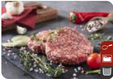
DANA BURGER Beef Burger

Ürün Kodu / Product Code : 1.01.04.0.600/601/602 Birim ağırlık / Unit weight : 40 g - 70 g - 100g ± 10% Ambalaj / Packaging : 1 kg / 2lb 3.2oz