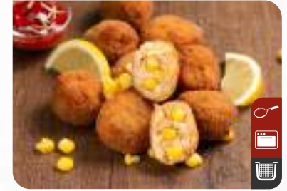
MISIRLI TAVUK TOPLARI (Acılı) Crispy Chicken Balls with Corn (Spicy)

Ürün Kodu / Product Code : 1.01.04.0.030 Birim ağırlık / Unit weight : 27 g ± 10% Ambalaj / Packaging : 1 kg / 2lb 3.2oz