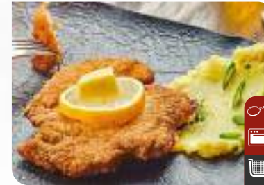
TAVUK SCHNITZEL Chicken Schnitzel

Ürün Kodu / Product Code : 1.01.04.0.050 / 051 Birim ağırlık / Unit weight : 250 g ± 10% / 125 g ± 10% Ambalaj / Packaging : 1 kg / 2lb 3.2oz 2 Sizes