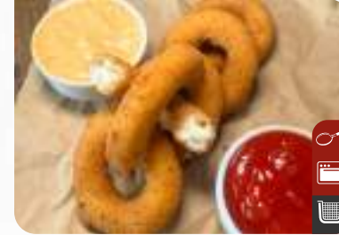
PEYNİRLİ SOĞAN HALKASI Onion Rings with Cheese

Ürün Kodu / Product Code : 1.01.09.0.111 Birim ağırlık / Unit weight : 20 g ± 10% Ambalaj / Packaging : 1 kg / 2lb 3.2oz