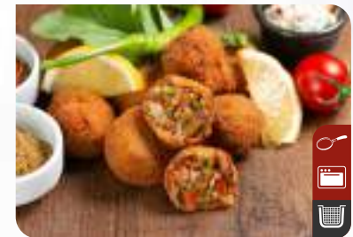
VEGAN ÇITIR SOTE Vegan Crispy Plant-Based Sautee

Ürün Kodu / Product Code : 1.01.04.V.030 Birim ağırlık / Unit weight : 25 g ± 10% Ambalaj / Packaging : 1 kg / 2lb 3.2oz