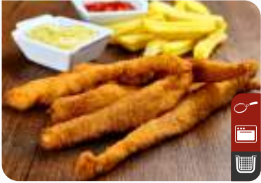
ÇITIR TAVUK Crispy Chicken Tenders

Ürün Kodu / Product Code : 1.01.04.0.001 / 002 Birim ağırlık / Unit weight : 28 g ± 10% / Varying Quantities Ambalaj / Packaging : 1 kg / 2lb 3.2oz 2 Sizes