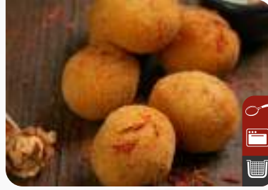
ÇITIR YOĞURLU PATLICAN EZME Crispy Eggplant Paste with Yoghurt

Ürün Kodu / Product Code : 1.01.02.0.402 Birim ağırlık / Unit weight : 22 g ± 10% Ambalaj / Packaging : 1 kg / 2lb 3.2oz