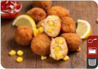
ÇITIR TAVUK TOPLARI (Mısırlı) Crispy Chicken Balls (With Corn)

Ürün Kodu / Product Code : 1.01.04.0.031 Birim ağırlık / Unit weight : 27 g ± 10% Ambalaj / Packaging : 1 kg / 2lb 3.2oz