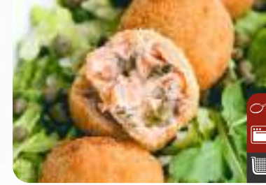
ÇITIR SOMON FÜME Crispy Smoked Salmon

Ürün Kodu / Product Code : 1.01.06.0.040 Birim ağırlık / Unit weight : 20 g ± 10% Ambalaj / Packaging : 1 kg/2lb 3.2oz