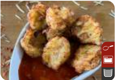
ÇITIR PATATES MÜCVERİ Hash Browns