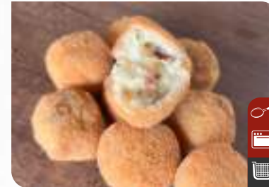
ÇITIR PATATES TOPLARI (LAHANA TUŐŐULU VE SOSİŐLİ) Crispy Potato Balls (with Pickled Cabbage and Sausage)

Ürün Kodu / Product Code : 1.01.09.0.251 Birim ağırlık / Unit weight : 20 g ± 10% Ambalaj / Packaging : 1 kg / 2lb 3.2oz