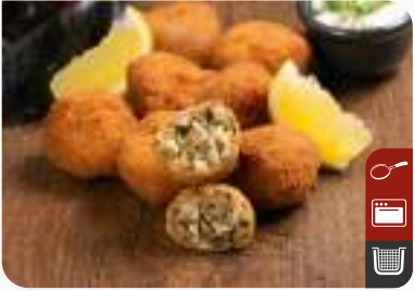
MİDYE TOPLARI Crispy Mussel Balls

Ürün Kodu / Product Code : 1.01.06.0.002 Birim ağırlık / Unit weight : 20 g ± 10% Ambalaj / Packaging : 1 kg/2lb 3.2oz