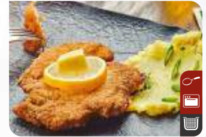
PİLİÇ BUT SCHNITZEL Chicken Drumsticks Schnitzel

Ürün Kodu / Product Code : 1.01.04.0.050 / 052 Birim ağırlık / Unit weight : 130 g ± 10% Ambalaj / Packaging : 1 kg / 2lb 3.2oz