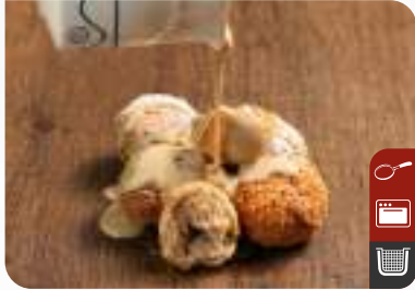
TAHİNLİ ÇITIR HELVA Crispy Tahini Halva