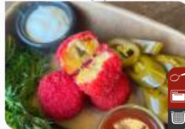
CHEDDAR PEYNİRLİ ÇITIR PATATES TOPLARI (ACILI) Crispy Potato Balls with Cheddar Cheese (Spicy)

Ürün Kodu / Product Code : 1.01.09.0.250 Birim ağırlık / Unit weight : 20 g ± 10% Ambalaj / Packaging : 1 kg / 2lb 3.2oz