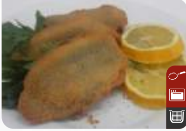
ÇITIR SARDALYA Crispy Sardine

Ürün Kodu / Product Code : 1.01.06.0.060 Birim ağırlık / Unit weight : 18 g ± 10% Ambalaj / Packaging : 1 kg / 2lb 3.2oz