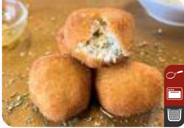
ÇITIR HAYDARI Crispy Haydari Appetizer

Ürün Kodu / Product Code : 1.01.02.0.401 Birim ağırlık / Unit weight : 22 g ± 10% Ambalaj / Packaging : 1 kg / 2lb 3.2oz