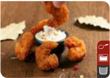
ÇITIR KARİDES Crispy Shrimp

Ürün Kodu / Product Code : 1.01.06.0.031 Birim ağırlık / Unit weight : 23 g ± 10% Ambalaj / Packaging : 1 kg/2lb 3.2oz