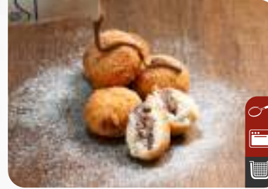
ÇITIR COCO Crispy Coco

Ürün Kodu / Product Code : 1.01.08.0.010 Birim ağırlık / Unit weight : 25 g ± 10% Ambalaj / Packaging : 1 kg / 2lb 3.2oz