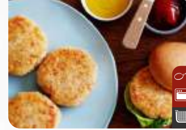
MINI TAVUK BURGER Mini Chicken Burger

Ürün Kodu / Product Code : 1.01.04.0.021 Birim ağırlık / Unit weight : 40g ± 10% Ambalaj / Packaging : 1 kg / 2lb 3.2oz