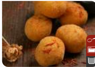
KARİDES TOPLARI Shrimp Balls

Ürün Kodu / Product Code : 1.01.06.0.032 Birim ağırlık / Unit weight : 20 g ± 10% Ambalaj / Packaging : 1 kg/2lb 3.2oz