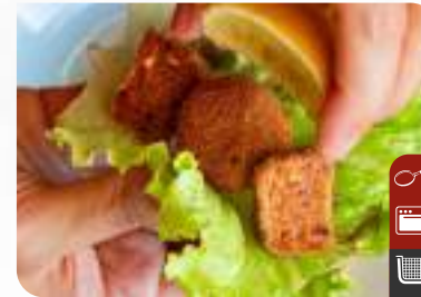
ÇITIR ÇİĞ KÖFTE (Peynirli) Crispy Raw Meatball (With Cheese) (Turkish cuisine)

Ürün Kodu / Product Code : 1.01.09.0.080 Birim ağırlık / Unit weight : 22 g ± 10% Ambalaj / Packaging : 1 kg / 2lb 3.2oz