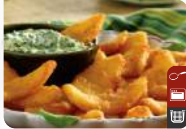
ÇITIR KAŐIK SOĞAN Crispy Spoon Onions