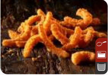
ÇITIR SOĞAN ŐERİTLERİ Crispy Onion Strips