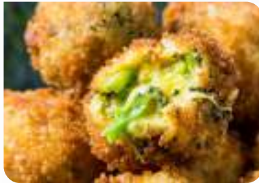
BROKOLİ PEYNİR TOPLARI Broccoli Cheese Balls

Ürün Kodu / Product Code : 1.01.09.0.050 Birim ağırlık / Unit weight : 25 g ± 10% Ambalaj / Packaging : 1 kg / 2lb 3.2oz