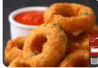
SOĞAN HALKASI Onion Rings