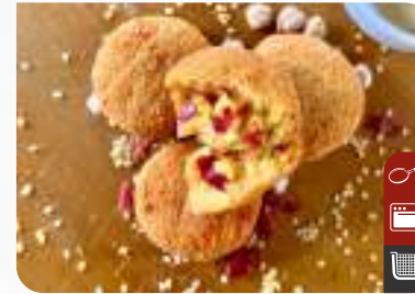
ÇEMENLİ ÇITIR HUMUS Hummus with Fenugreek

Ürün Kodu / Product Code : 1.01.08.0.002 Birim ağırlık / Unit weight : 20 g ± 10% Ambalaj / Packaging : 1 kg / 2lb 3.2oz