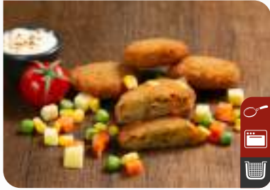
MINI SEBZE BURGER Mini Veggie Burger