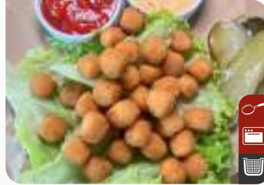
ÇITIR TOFU KÜPLERİ Crispy Tofu Cubes

Ürün Kodu / Product Code : 1.01.02.V.010 Birim ağırlık / Unit weight : 20 g ± 10% Ambalaj / Packaging : 1 kg / 2lb 3.2oz