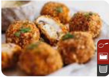
ÇITIR MANTAR Crispy Mushroom

Ürün Kodu / Product Code : 1.01.09.0.016 Birim ağırlık / Unit weight : 22 g ± 10% Ambalaj / Packaging : 1 kg / 2lb 3.2oz