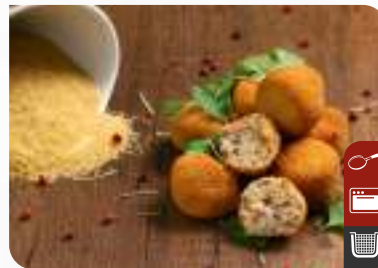
VEGAN JEFE İÇİ KÖFTE Vegan Jefe Breaded Meatballs

Ürün Kodu / Product Code : 1.01.04.V.001 Birim ağırlık / Unit weight : 25 g ± 10% Ambalaj / Packaging : 1 kg / 2lb 3.2oz