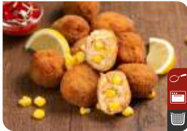
ÇITIR TAVUK TOPLARI (Peynirli) Crispy Chicken Balls (With Cheese)

Ürün Kodu / Product Code : 1.01.04.0.032 Birim ağırlık / Unit weight : 27 g ± 10% Ambalaj / Packaging : 1 kg / 2lb 3.2oz