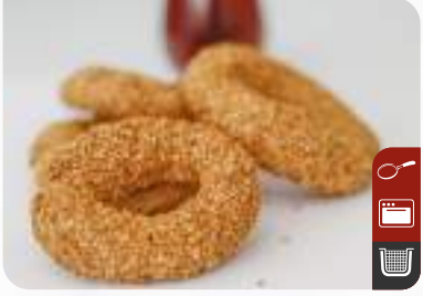
BALIK ÜMİT Fish Bagel

Ürün Kodu / Product Code : 1.01.06.0.050 Birim ağırlık / Unit weight : 18 g ± 10% Ambalaj / Packaging : 1 kg / 2lb 3.2oz