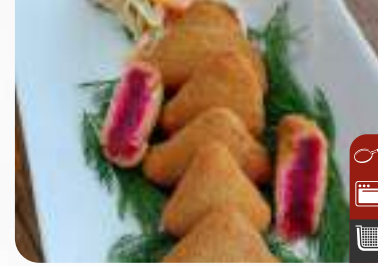
ÇITIR PANCAR Crispy Beets