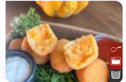
ÇITIR BALKAPAĐI TOPLARI Crispy Pumpkin Balls

Ürün Kodu / Product Code : 1.01.09.0.252 Birim ağırlık / Unit weight : 20 g ± 10% Ambalaj / Packaging : 1 kg / 2lb 3.2oz