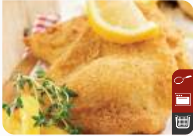
ÇITIR İŞKEMBE SCHNITZEL Crispy Beef Tripe Schnitzel

Ürün Kodu / Product Code : 1.01.04.0.331 Birim ağırlık / Unit weight : 125 g ± 10% Ambalaj / Packaging : 1 kg / 2lb 3.2oz