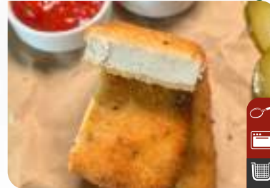
ÇITIR TOFU XL Crispy Tofu XL

Ürün Kodu / Product Code : 1.01.02.V.011 Birim ağırlık / Unit weight : 10 g ± 10% Ambalaj / Packaging : 1 kg / 2lb 3.2oz