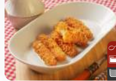
ÇITIR KÜNEFE Crispy Kunefe

Ürün Kodu / Product Code : 1.01.08.0.050 Birim ağırlık / Unit weight : 20 g ± 10% Ambalaj / Packaging : 1 kg / 2lb 3.2oz