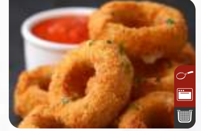
PEYNİRLİ JALAPENO TANELİ SOĞAN HALKASI