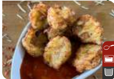
PEYNİRLİ PATATES MÜCVERİ Hash Browns with Cheese