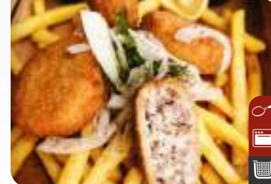
VEGAN JEFE KADINBUDU KÖFTE Vegan Meatballs With Rice