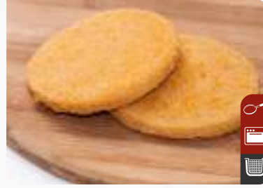
TAVUK BURGER Chicken Burger

Ürün Kodu / Product Code : 1.01.04.0.020 Birim ağırlık / Unit weight : 115 g ± 10% Ambalaj / Packaging : 1 kg / 2lb 3.2oz