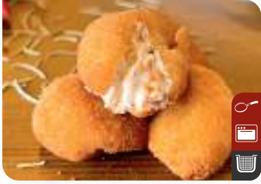
ÇITIR ATOM Crispy Atom Appetizer

Ürün Kodu / Product Code : 1.01.02.0.400 Birim ağırlık / Unit weight : 22 g ± 10% Ambalaj / Packaging : 1 kg / 2lb 3.2oz