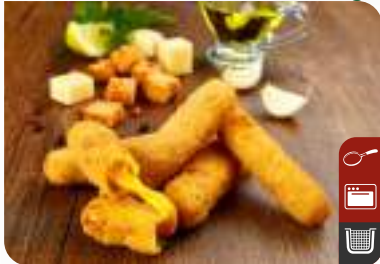
VEGAN CHEDDAR STICKS Vegan Cheddar Cheese Sticks

Ürün Kodu / Product Code : 1.01.02.V.002 Birim ağırlık / Unit weight : 22 g ± 10% Ambalaj / Packaging : 1 kg / 2lb 3.2oz