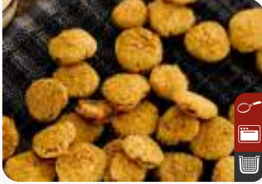
ÇITIR KORNİŞON CIPSI Crispy Pickle Chips