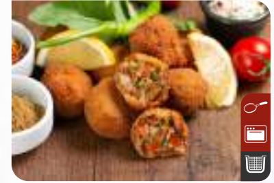
BALIK KOKOREÇ Fish Kokorec

Ürün Kodu / Product Code : 1.01.06.0.022 Birim ağırlık / Unit weight : 20 g ± 10% Ambalaj / Packaging : 1 kg/2lb 3.2oz