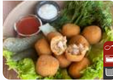
PATATESLİ BAGET TOPLARI Chicken Drumsticks Balls with Potatoes

Ürün Kodu / Product Code : 1.01.04.0.033 Birim ağırlık / Unit weight : 22 g ± 10% Ambalaj / Packaging : 1 kg / 2lb 3.2oz