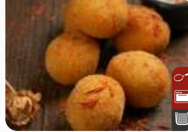
ÇITIR YOĞURLU KÖZLENMİŞ BİBER Crispy Roasted Pepper with Yoghurt

Ürün Kodu / Product Code : 1.01.02.0.403 Birim ağırlık / Unit weight : 20 g ± 10% Ambalaj / Packaging : 1 kg / 2lb 3.2oz