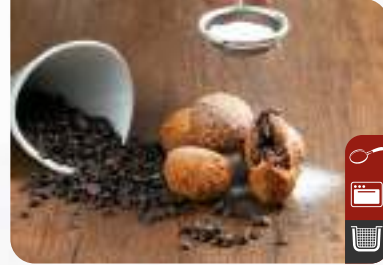
ÇİKOLATALI ÇITIR HELVA Crispy Chocolate Halva

Ürün Kodu / Product Code : 1.01.08.0.001 Birim ağırlık / Unit weight : 25 g ± 10% Ambalaj / Packaging : 1 kg / 2lb 3.2oz