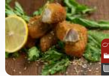
ÇITIR MEZGİT S/XL Crispy Haddock